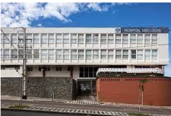
Hospital São Lucas