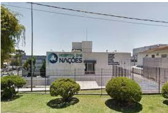
Hospital das Nações