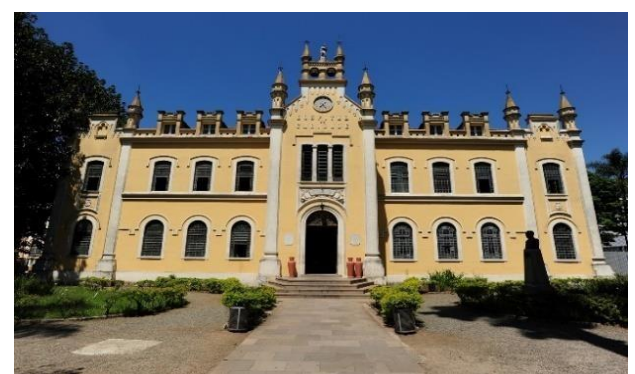
Santa Casa de Misericórdia de Curitiba