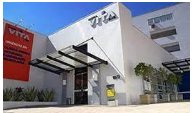
Hospital Vita Batel