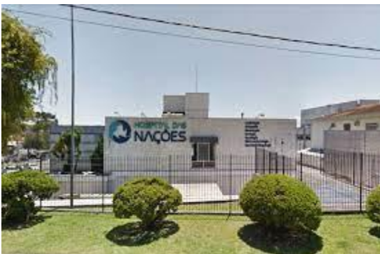
Hospital das Nações