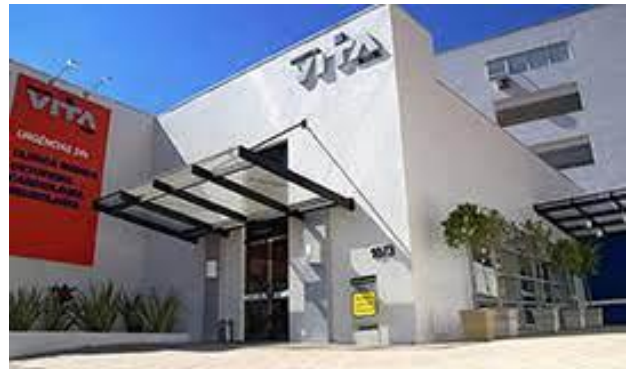
Hospital Vita Batel