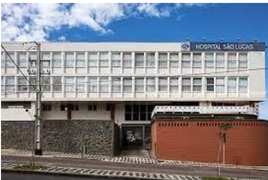
Hospital São Lucas